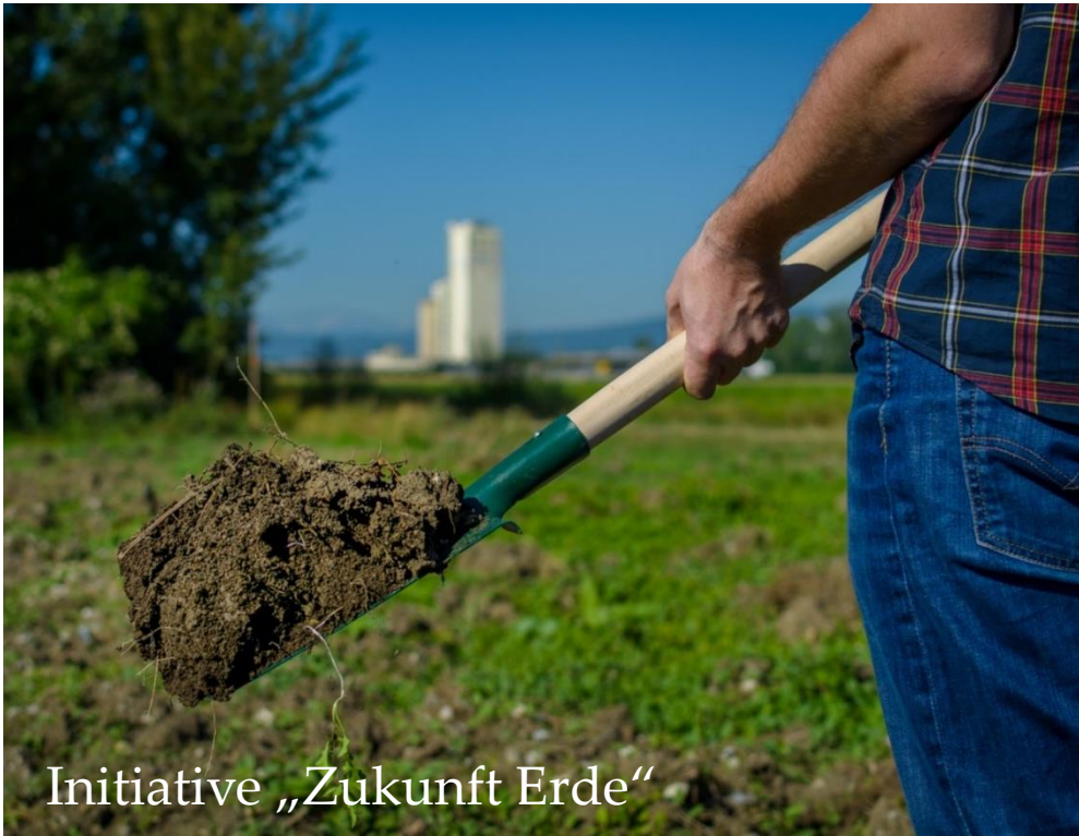
Initiative „Zukunft Erde“